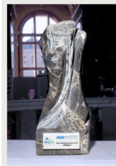
Abbildung 2: Information zu Auszeichnungen in Bezug auf Nachhaltigkeit auf der Homepage

Nachdem dieses Projekt bereits im Frühjahr bei den Österreichischen Nachhaltigkeitspreisen des Forums mineralische Rohstoffe ausgezeichnet wurde, sind wir besonders stolz, dass unser Engagement nun auch auf europäischer Ebene gewürdigt wurde.